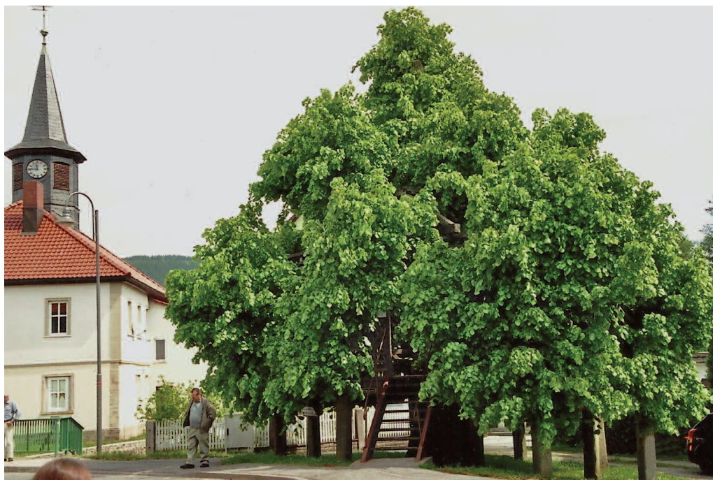
42 | Die Sachsendorfer Tanzlinde im Landkreis Hildburghausen (Thüringen) ist etwa 360 Jahre alt, hat eine Höhe von 13 Metern sowie einen Kronendurchmesser von 11 Metern. Der Stammumfang beträgt 4,30 Meter. Damit ist sie die älteste und umfangstärkste Tanzlinde in Deutschland. · Fotos: Friedhelm Blume

Obwohl den Linden gesellschaftlich ein großer Stellenwert beigemessen wird, kommen sie in forstlich bewirtschafteten Wäldern kaum noch vor. Das weiche Holz ist jedoch hervorragend zum Schnitzen geeignet. Die Heiligenstatuen der Gotik, zum Beispiel von Tilman Riemenschneider und Veit Stoß, sind überwiegend aus Lindenholz. Zur Herstellung mancher Küchenutensilien, wie Kochlöffel, Modeln und vieles mehr aus Omas Küche, sowie Holzpantoffeln und verschiedener Musikinstrumente wie Harfen und Gitarren wurde und wird ebenfalls